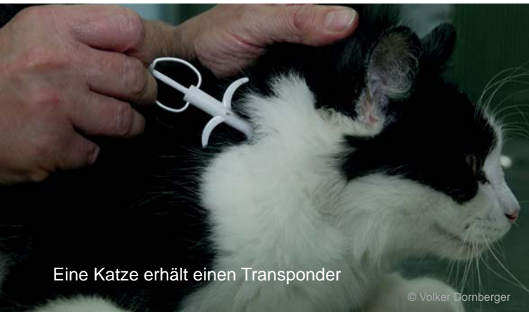
Eine Katze erhält einen Transponder