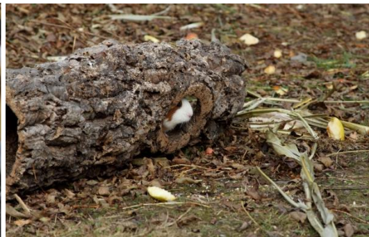
Ein hohler Baumstamm mit Astloch dient als Versteck mit Ausblick