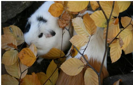
Zweige werden als Versteck genutzt und ausgiebig benagt

Zusätzlich zum Schlafhaus sollte man den Tieren zahlreiche Unterschlüpfе und Hindernisse als Versteckmöglichkeiten anbieten. Das Gehege sollte abwechslungsreich gestaltet sein und viele Beschäftigungsmöglichkeiten enthalten. In einen Teil des Geheges, der stets trocken bleibt, können beispielsweise feiner Sand und einige Tonröhren eingebracht werden. Steine und Holzstücke dienen als Ausguck, Wurzeln und überhängende Zweige als Verstecke.