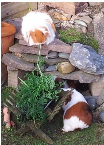
Steine schaffen verschiedene Ebenen

Der Boden des Geheges soll so trocken wie möglich sein – die Bodeneinstreu kann vielgestaltig sein (Kies, Rindeneinstreu, Moos, Steinplatten und Ähnliches), denn unterschiedliche Bodenstrukturen wirken anregend und sie begünstigen das Abwetzen der Krallen.