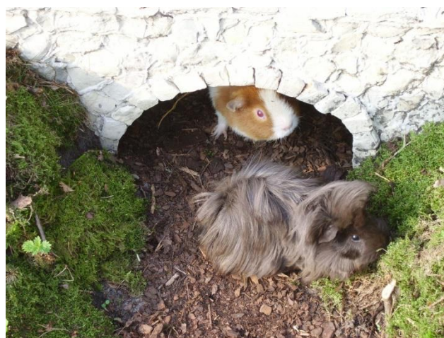
Bodengrundmaterialien wie Rindeneinstreu, Gras oder Moos bereichern den Alltag der Meerschweinchen